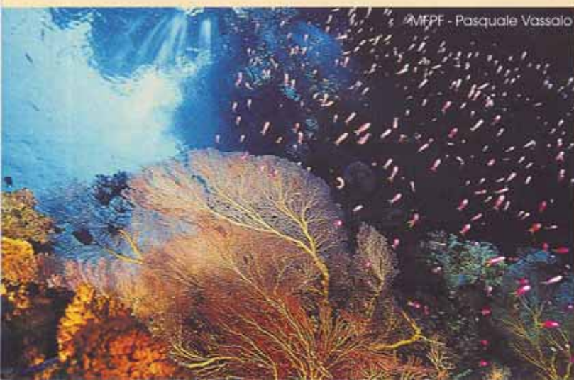
MFPE - Pasquale Vassalo