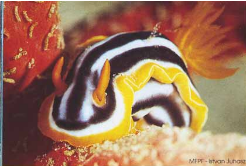
MFPE - Istvan Juhasz