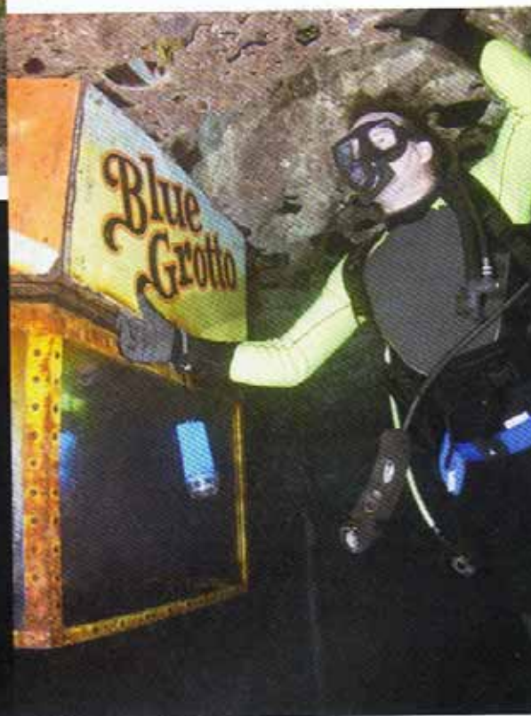
A Blue Grotto bejárata lentről

mulatságos látványt keltettek a többiek a búvármester előtt térdelve.