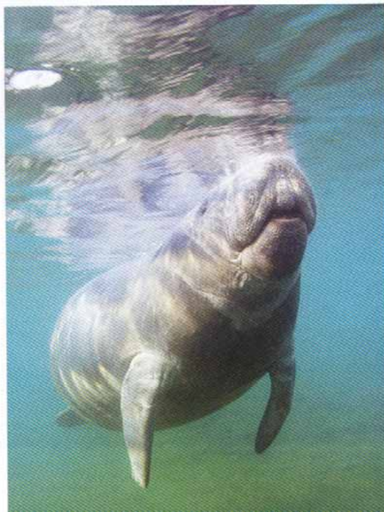
A Crystal River háziállata: a békés lamantinok, azaz tengeri tehének

A Florida Keys szigetlánc környékén lehetőségünk van szebbnél szebb korallzátonyok mellett merülni, vagy éppen a hajóroncsok sejtelmes látnivalóiban gyönyörködni. Florida közepén a nyugati oldalon található Crystal River nevű helyen szinte egész évben élvezhetjük az ismerkedést az ott található tengeri tehennel. Három évvel első látogatásom után visszatérve a legnagyobb újdonságot mégis az édesvízi források barlangjaiban történt merüléseim jelentették.