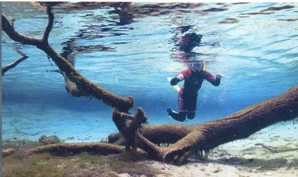
Florida és a lányom